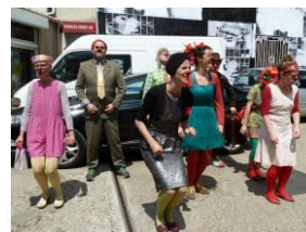
La Clown Airlines Company - Compagnie À Vol d'Oiseau depuis 2010 (Franoise Simon)